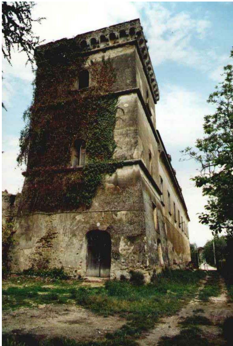
Figura 2. Veduta della Torre del Casale

Queste difficoltà, non certo di poco conto, congiunte alle ingenti spese legali che il comune di Succivo dovette affrontare nella disputa con l'ex feudatario, andarono a incidere pesantemente sul budget comunale, tanto da indurre l'amministrazione, nel 1859, a deliberare l'abbandono del Casale, dove per secoli si era svolto il mercato-fiera più importante nella provincia.