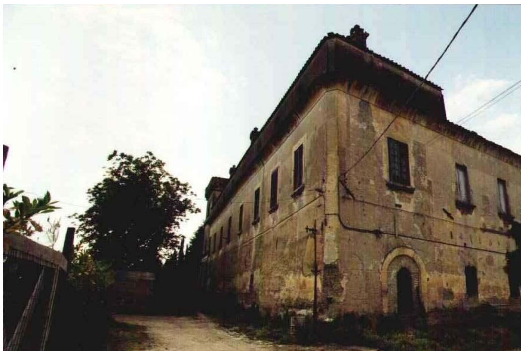
Figura 1. Veduta del Casale di Teverolaccio (Succivo)

Teverolaccio; ma già a partire dal 1850, e poi più esplicitamente nel 1859, nei regolamenti di polizia rurale, all'articolo fiere e mercati si legge "che tutti venditori di commestibili dovranno regolare il prezzo in base alle assise del mercato di Aversa" 19 . Segno questo, oramai, della piena decadenza.