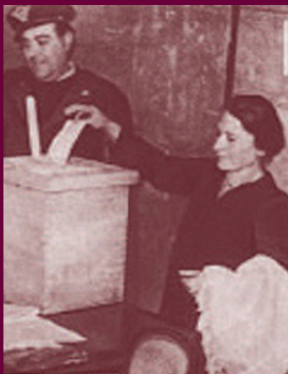
Donne per la prima volta alle urne da L'Europeo, 25 marzo 1946